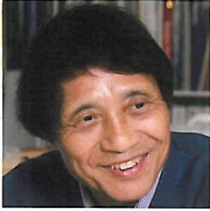
講師略歴： 安藤 忠雄 氏